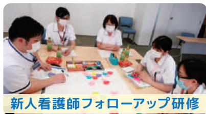
新人看護師フォローアップ研修