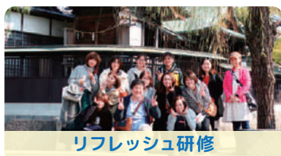
リフレッシュ研修