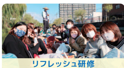
リフレッシュ研修