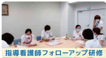
指導看護師フォローアップ研修