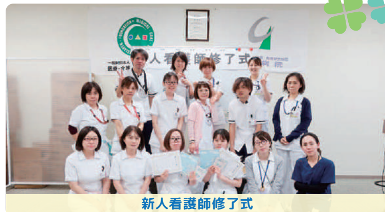
新人看護師修了式

柳川病院では、たくさんの新人看護師を採用することはできませんが、各部署で一人ひとりを大切に育て、ともに成長し、地域の皆様に「柳川病院に来て良かった」と言ってもらえるよう、看護の質を高める努力をし続けていきたいと思っています。