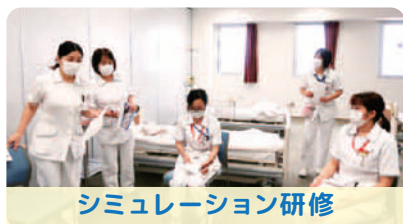
シミュレーション研修