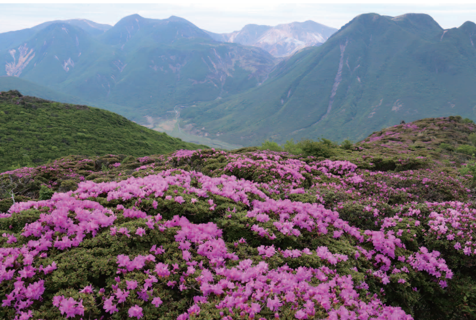
「ミヤマキリシマ」（撮影地 平治岳）